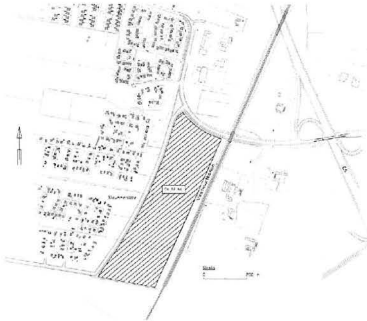
Figur 1: Aktuellt område

Utredningsområdet är beläget väster om Väskustbanan och öster om Allarpsvägen.