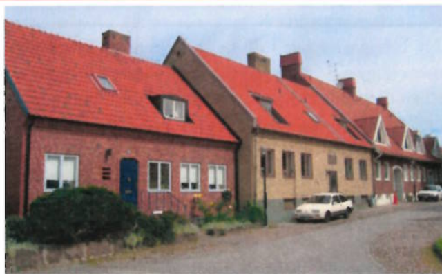
Bebyggelsen bör underordna sig småstadsstrukturen!