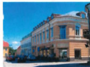
I Handelscentrum är bostadshusen mer påkostade. .