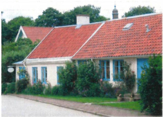
Grönskan betyder mycket för Laholms stadskärna

Uteserveringens färg och form får inte dominera hus och gata. Låt den inordna sig och vara med och bidra till en trevlig sommarstämning. Välj gärna enkla och robusta material, kraftiga kanvastyger, grovhuggen granit eller järn i pollare och trä eller metall i stolarna.