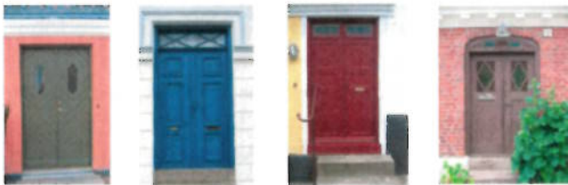
Tecken för stadsgårdar är paryttedörrar

Gatuhuset bildade tillsammans med stall, logar, magasin, svinstior, hönsbhus och bryggshus med mera en näst intill kringbyggd enhet. Gödselstaccor inne på gårdarna hörde till vanligheten. Vanligtvis var husen uppförda i en våning med fasader i tegel eller korsvirke vilka ibland putsades. Andra vanliga kännetecken för stadsgårdarna är paryttedörrar, körport in till gården, spröjsade tvåluftsfönster och en artikulerad takfris.