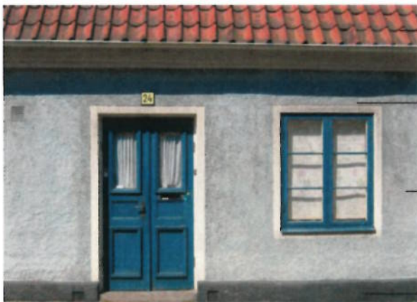
Rött enkupigt tegeltak