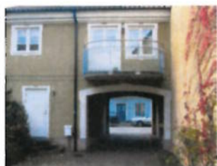
Portar och portgångar är typiska för Laholm och bör bevaras.

I Handelscentrum är bostadshusen mer påkostade. De är uppförda i en eller två våningar och med en utformning som varierade med handelsmannens ekonomiska ställning. Det är viktigt att slå vakt om den blandade bebyggelsen i Handelscentrum. Ersättningsbyggnader bör få samma proportioner som den ursprungliga bebyggelsen hade, för att inte störa helhetsbilden i området.