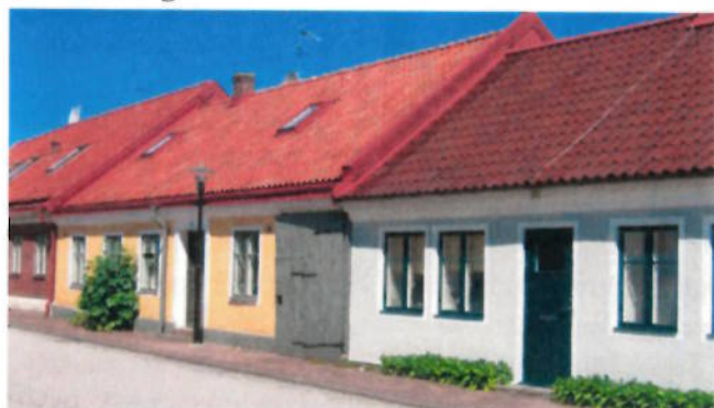
Gränd i Gamleby