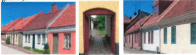
Typiska stadsgårdar i Gamleby

Sinnebilden av Laholm är för många den småskaliga bebyggelse som till största delen uppfördes under 1800-talet i form av stadsgårdar, vilket var en kombination av arbetsplats och bostad. Det fanns vid 1800-talets mitt en bra bit över hundra sådana gårdar i Laholm, till största delen belägna i dagens Gamleby. Bostadshuset var beläget utmed huvudgatan och vanligtvis sammanbyggt med grannfastigheten vilket gjorde att de fick ett gemensamt fasadliv i gatulinjen.