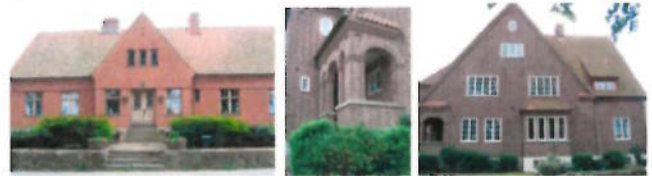
Villor på Danska vägen

I början av 1900-talet expanderade staden åt öster och söder. Utmed den gamla utfartsvägen söderut, Danska vägen, uppfördes stora påkostade villor i en nationalromantisk anda. De har fasader i mörkt tegel och mönstermurade detaljer, ofta med kantiga burspråk och branta takfall.