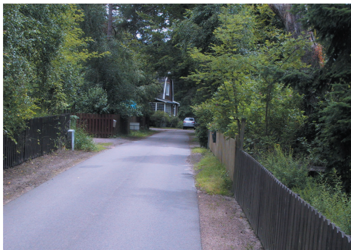
Förändra inte gatans karaktär. Den gröna och lummiga gatumiljön är en viktigt del av Mellbystrand och Skummeslövstrand.

I de fall staket förekommer bör de ges en nedtonad färg för att inte bli dominerande i landskapet.