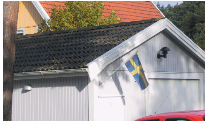
Takmaterialeen i kustområdet bör utgöras av äkta materiäl, exempelvis tegel- eller betongpannor.