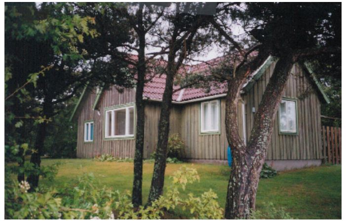
Låt tomten styra hur huset och tillbyggnaden ska utformas.

En stävan ska vara att bebyggelsen är underordnad landskapet. Det innebär att bebyggelsen ska vara lägre än vegetationen och inte ges någon framträdande placering i landskapet.