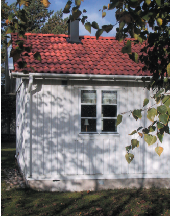
Fasadmateriälet som passar bäst i kustområdet är trä.

Behåll den nuvarande materialkaraktären med stående eller liggande träpanel. Trä är traditionsenligt det fasadmateriäl som passar bäst i kustlandskapet. Trä i kombination med puts kan vara ett alternativ.