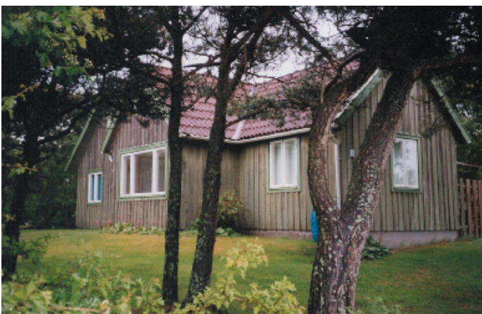
Byggnader som ligger en bit från havet i tallskogen är ofta laserade i naturfärger och smälter väl in i naturen.

Traditionellt har husen färgsatts olika beroende på var i området de låg. Nära stranden är husen ljusa, medan de längre från stranden ofta är laserade i naturfärger; grått, grönt och brunt. De äldre husen ligger ofta väl indragna på tomten. Fasaden är klädd med träpanel i falurött, bruna, grå eller vita färger.