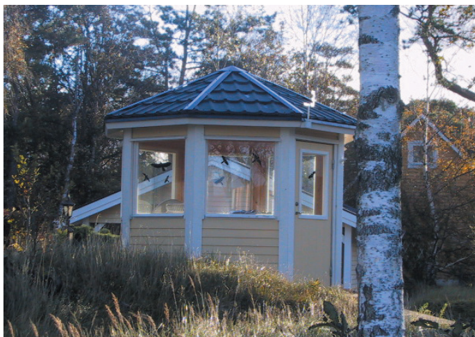
Ett lusthus kan vara ett alternativ till ett uterum. Det placeras fristående från huvudbyggnaden, vilket gör att det lättare kan anpassas till huset och tomten.

Uteplatsen kan anläggas på trädäck så skadas inte marken av omfattande markarbeten.