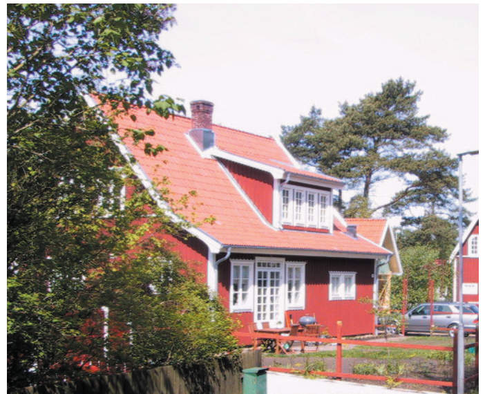
Äldre byggnader är ofta klädda med träpanel färgsatt i falurött eller bruna färger.

Leta gärna efter ett vackert färgsatt hus. Fråga vilket nummer färgen har för att hitta exakt samma nyans. Med tiden bleknar färgen och man bör vara medveten om att om huset målas med samma färg kan det ändå upplevas olika beroende på ljusförhållande och färgens ålder.