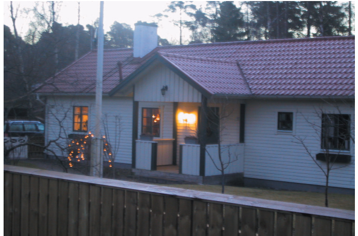
Belysning är viktigt under den mörka delen av året.

Släck inte månen! Lys inte upp omgivningen för mycket så att natten inte bli mörk.