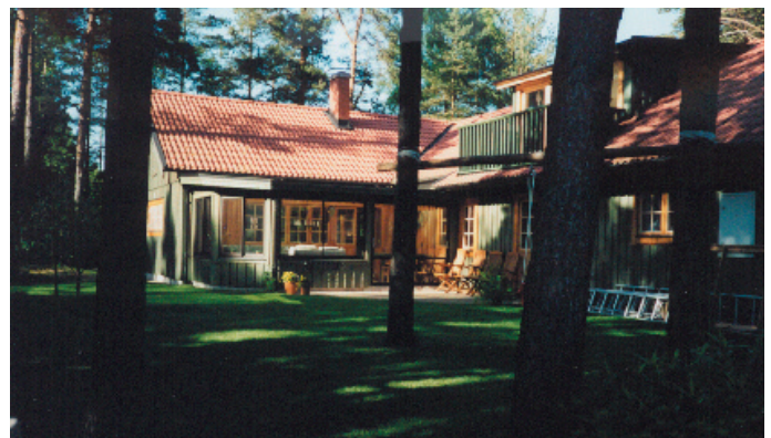
Altaner som anläggs på trädäck skadar inte marken och kan göra att skillnaden mellan ute och inne blir liten.