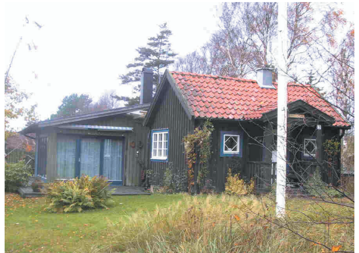
Anpassa tillbyggnaden till det ursprungliga huset. Det får gärna synas vilken del av byggnaden som är ny.

Tillbyggnaden kan placeras fristående från det ursprungliga huset. Huskropparna kan fogas samman med en länk som utgör en lättare sammanbyggnad mellan dem.