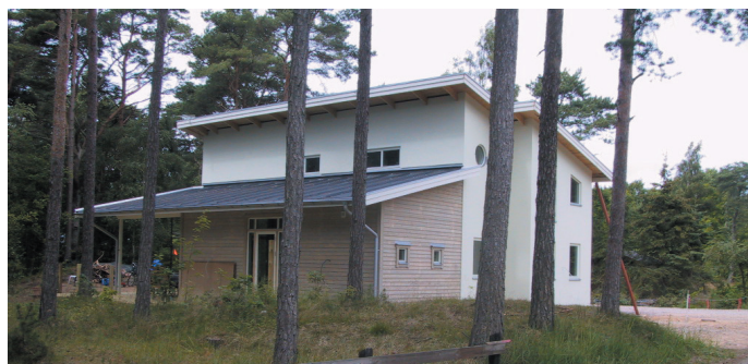
Spara befintlig vegetation på tomten. Det tar lång tid innan nyplanterad vegetation får full storlek och karaktär.

Ditt hus är grannens utsikt! Ta hänsyn till grannen och kringliggande bebyggelse. Bygg inte igen utblickar mot havet eller landskapet.