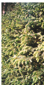
I kustområdet ersätter häckar ofta plank och murar. Detta ger gatan en grön och lummig karaktär.